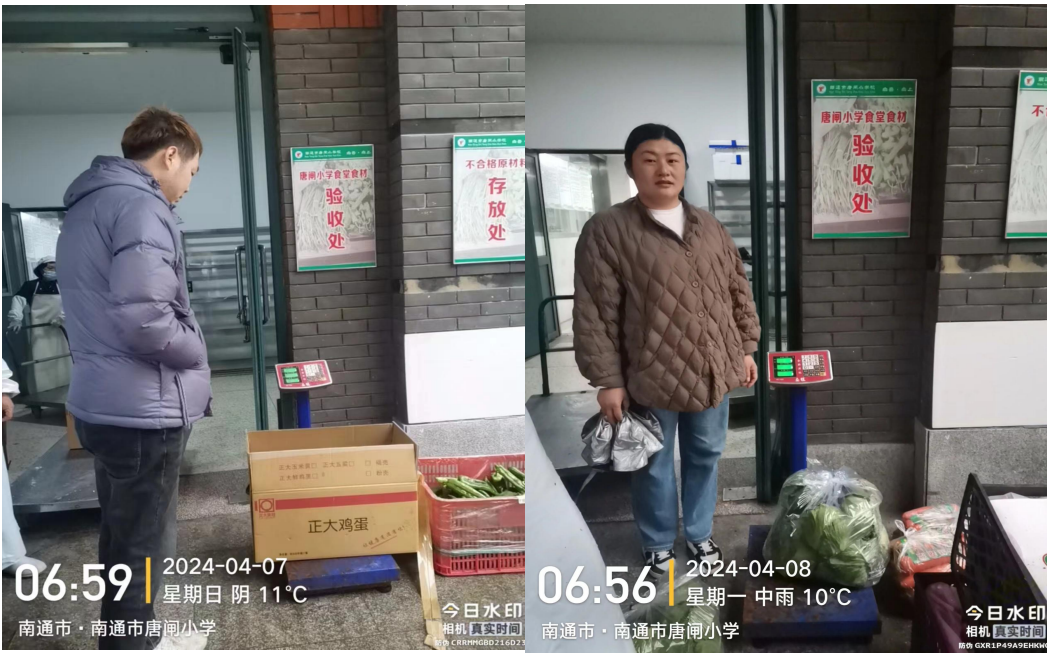
家长陪餐实景照片