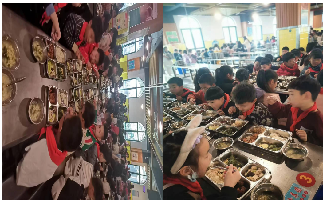
家长验菜实景照片